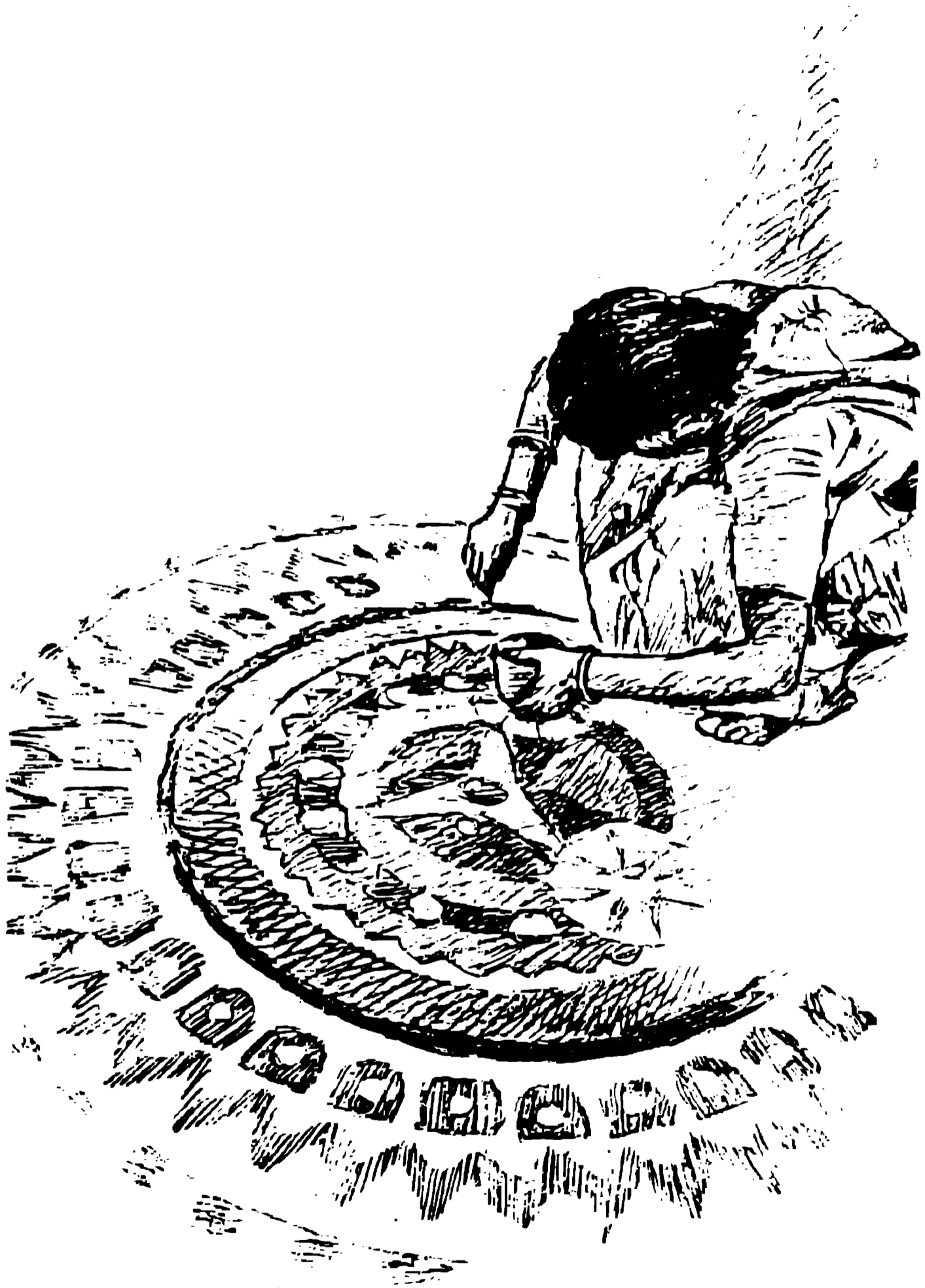
चित्र : पोंगल के अवसर पर कोलम बनाती एक युवती